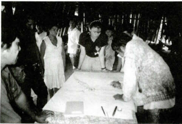
Copacabana de Chimimita. Grupo IFRI ve al mapeo que hacen los indígenas de su comunidad y las áreas de bosques donde extraen sus recursos. Ejercicio de DRP.